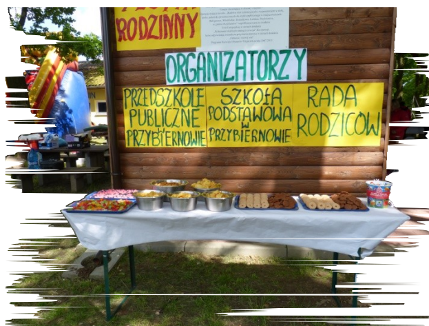
Poczęstunek w formie szwedzkiego stołu.

Wspólne spędzenie czasu, gry i zabawy w których uczestniczyły całe rodziny sprawiło, że rodzina miała więcej czasu na zabawę ze swoimi pociechami. Najmłodszy mieli możliwość zabawy ze starszymi kolegami.