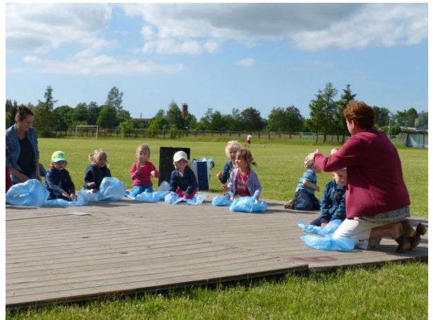
Występy dzieci z Przedszkola Publicznego oraz uczniów ze Szkoły Podstawowej w Przybiernowie.