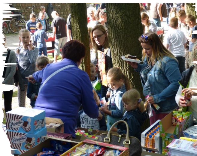
Wszystkie dzieci otrzymały upominki z okazji ich święta.