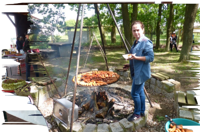
Po części artystycznej, konkursach i zawodach był czas na odpoczynek przy kielbasce i cięście.